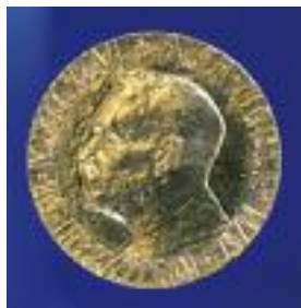
Prix Nobel de la Paix en 1968

comme délégué de la France auprès de Léon Blum à la conférence des 44 pays qui décident la création de l'Unesco et de fixer son siège à Paris.