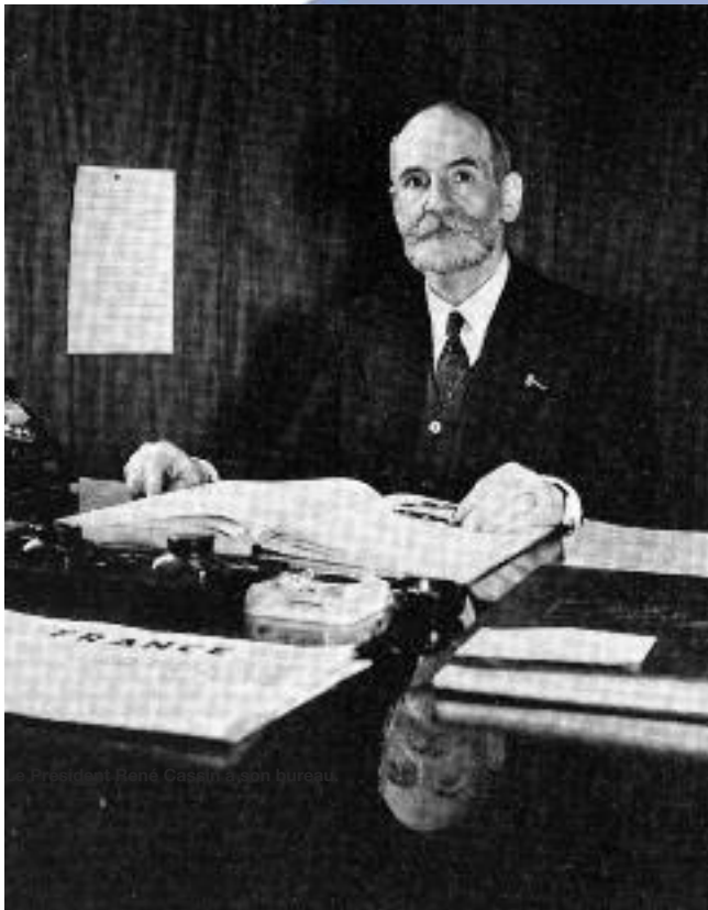
Le Président René Cassin à son bureau.