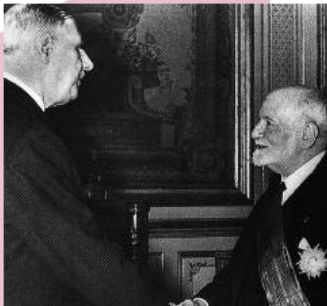
Charles de Gaulle et René Cassin

Ce « Fantassin des Droits de l'Homme » comme il aimait à s'appeler, a creusé dans son siècle un sillon que nul ne pourra sans péril laisser se refermer. Parce que cet homme n'appartient à personne, il mérite l'hommage de tous. »